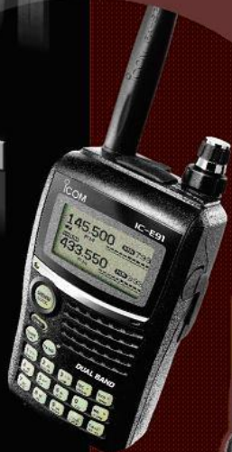
VHF/UHF Dual Band Transceiver IC-E91